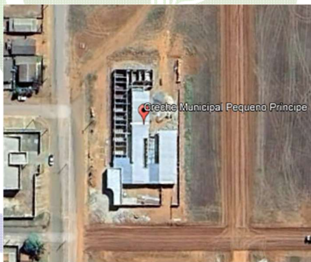
Imagem: localização do empreendimento, lote 01.

A obra em questão refere-se à Construção de Coberturas para os Parques de Areia e Passarela nas Creches Municipais e Centro Municipal de Educação Infantil, localizado em três lotes na Avenida Governador Júlio Campos.