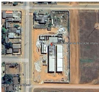
Imagem: localização do empreendimento, lote 03.